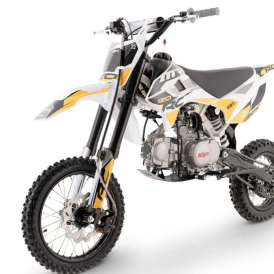
PIT BIKE MRF 120 RC 5399,00 PLN/brutto