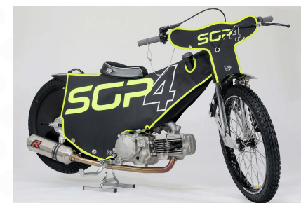
SGP4 BIKE 22.000,00 PLN/netto