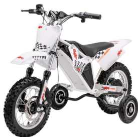
PIT BIKE MRF EKMB 4499,00 PLN/brutto