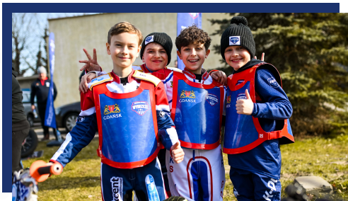
Zwiększenie liczby adeptów z 4 do 17