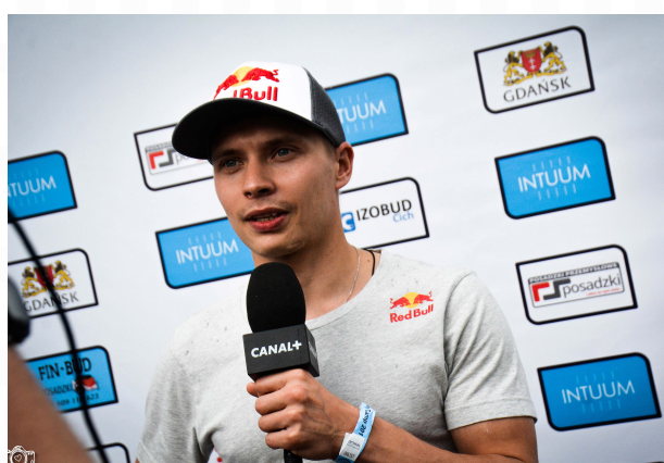
Ścianka do wywiadów