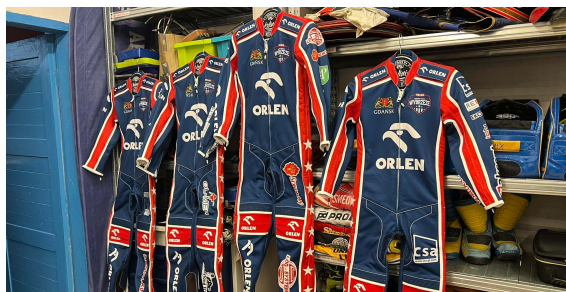
KOMBINEZON ŻUŻLOWY 3500,00 PLN/netto