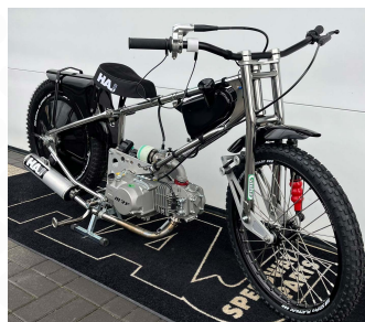
MINI MOTOR ŻUŻLOWY 16.900,00 PLN/netto