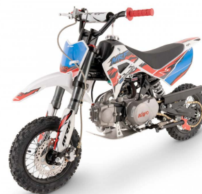
PIT BIKE MRF 80 RUNNER 4799,00 PLN/brutto